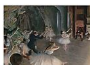
THE REHEARSAL ON STAGE, Edgar Degas, 1874