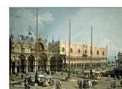
THE SQUARE OF SAINT MARK'S, Venice, Gennaro Candello, 1742-44