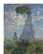
WOMAN WITH A PARASOL, MADAME MONET AND HER SON Claude Monet, 1875