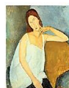
JEANNE HEBUTERNE, Amedeo Modigliani, 1919