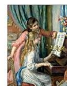
TWO YOUNG GIRLS AT THE PIANO, Auguste Renoir, 1892