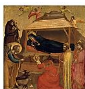
THE ADORATION OF THE MAGI, Giotto, 1320