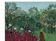
TROPICAL FOREST WITH MONKEYS, Henri Rousseau, 1910