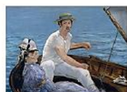
BOATING, Edouard Manet, 1874