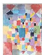
SOUTHERN GARDENS, Paul Klee, 1913