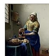
THE MILKMAID, Johannes Vermeer, 1660