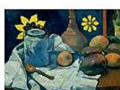
STILL LIFE WITH TEAPOT AND FRUIT, Paul Gauguin, 1896