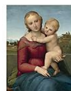
THE SMALL COWPER MADONNA, Raffaello Sanzio, c. 1505