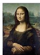
MONNA LISA, Leonardo da Vinci, c. 1503-06