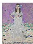
MADA PRIMAVERA, Gustav Klimt, 1912-13