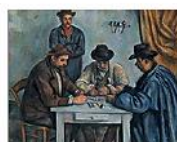
THE CARD PLAYERS, Paul Cezanne, 1890-92